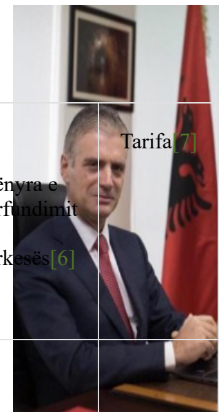
Drejtor Ekzekutiv i AKBN