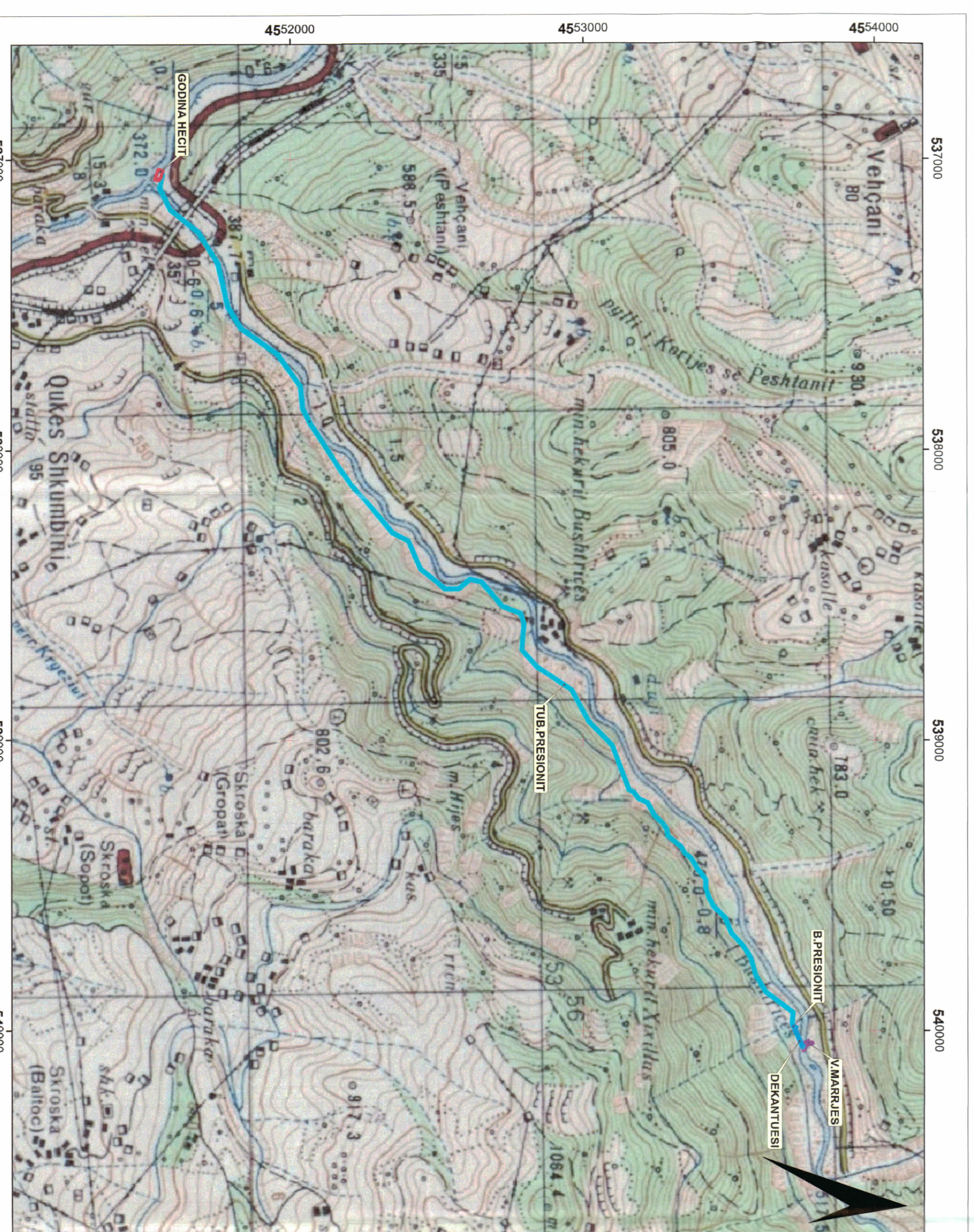
POZICIONI I STRUKTURËS NË HARTËN TOPOGRAFIKE. SHK. 1:12 000